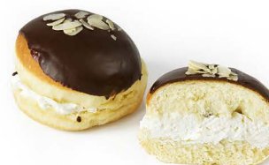
pączek z kremem i top czek.