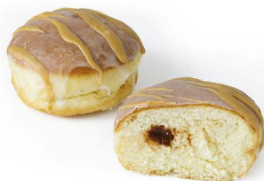
pączek z powidła śliwkowe