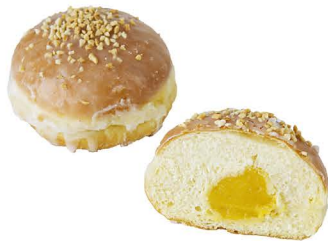
pączek z adwokatem