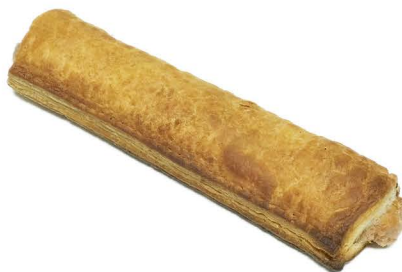
8" sausage rolls