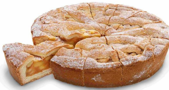
luksusowe ciasto jabłkowe