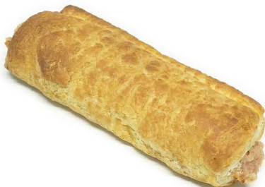
6" sausage rolls