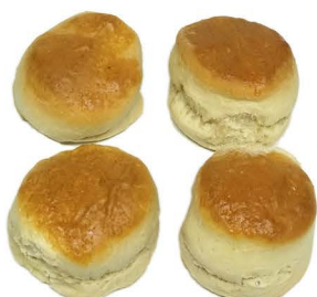
scones (4 pack)