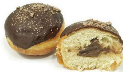
pączek z czekoladą