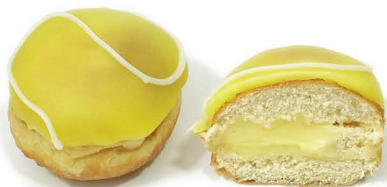
pączek z budyniem