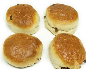
scones z rodzynekami (4 pack)