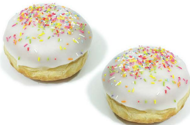
pączek z dżemem różanym