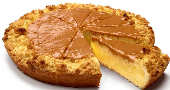
szarlotka z kruszonką i karmelem