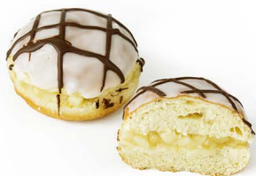
pączek z jabłkiem i top czek.