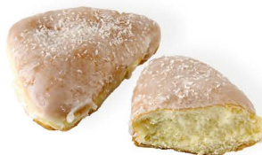
rożek z serem