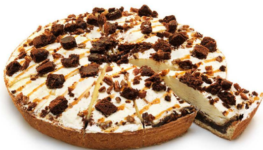
ciasto orzechowe z białą czekoladą