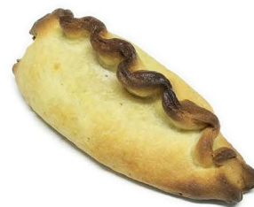
paszteciki z wołowiną i warzywami