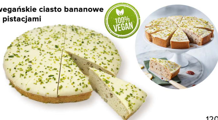
wegańskie ciasto bananowe z pistacjami