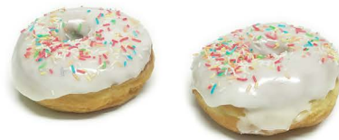
oponka z posypką