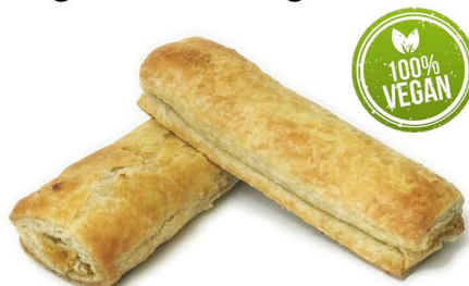
wegańskie sausage roll