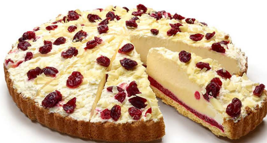
biała czekolada i owoce lesne