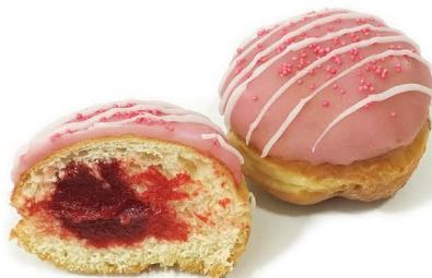
pączek z truskawką