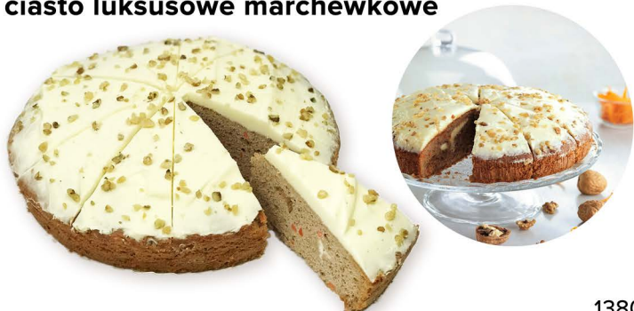
ciasto luksusowe marchewkowe