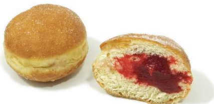
pączek z dżem wieloowoc