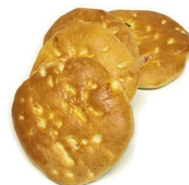
ciastka herbaciane (4 pack)